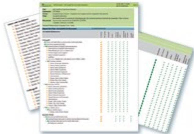
Leichtverständliche Reporte für Management und Fachabteilungen

In IdM-Projekten unterstützt 8MAN und liefert verlässliche und wertvolle Informationen über die faktische Berechtigungslage und ermöglicht SOLL-IST Vergleiche. 8MAN fungiert ebenso als Baustein zur Zertifizierung für die wichtigsten, heute geltenden gesetzlichen und regulatorischen Vorgaben (z.B. BSI, SOX, ISO, PCI-DSS, BDSG).